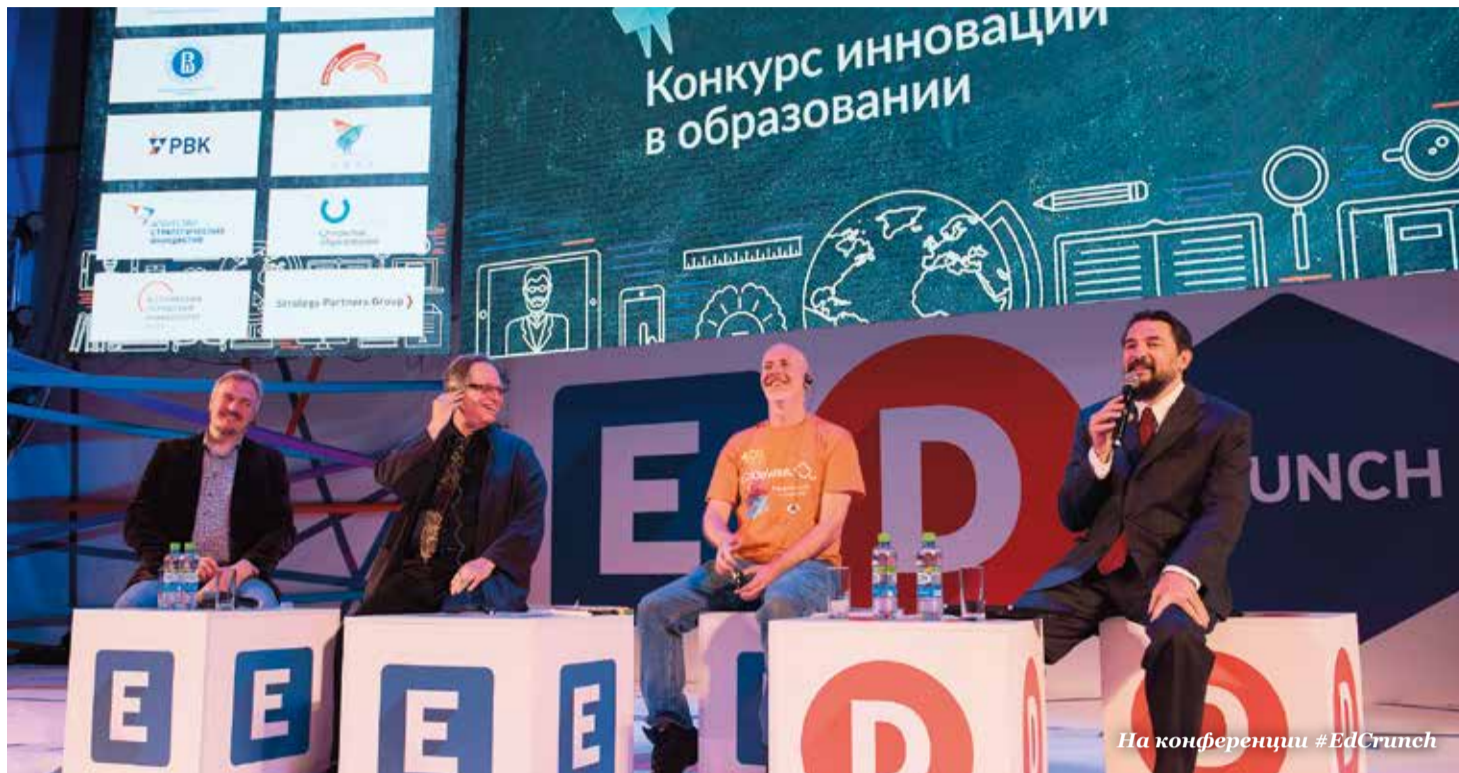
На конференции #EdCrunch

Под таким девизом НИТУ «МИСиС» провел ежегодную международную конференцию по новым образовательным технологиям #EdCrunch. Ее главной темой стало «Смешанное обучение: традиции и будущее».