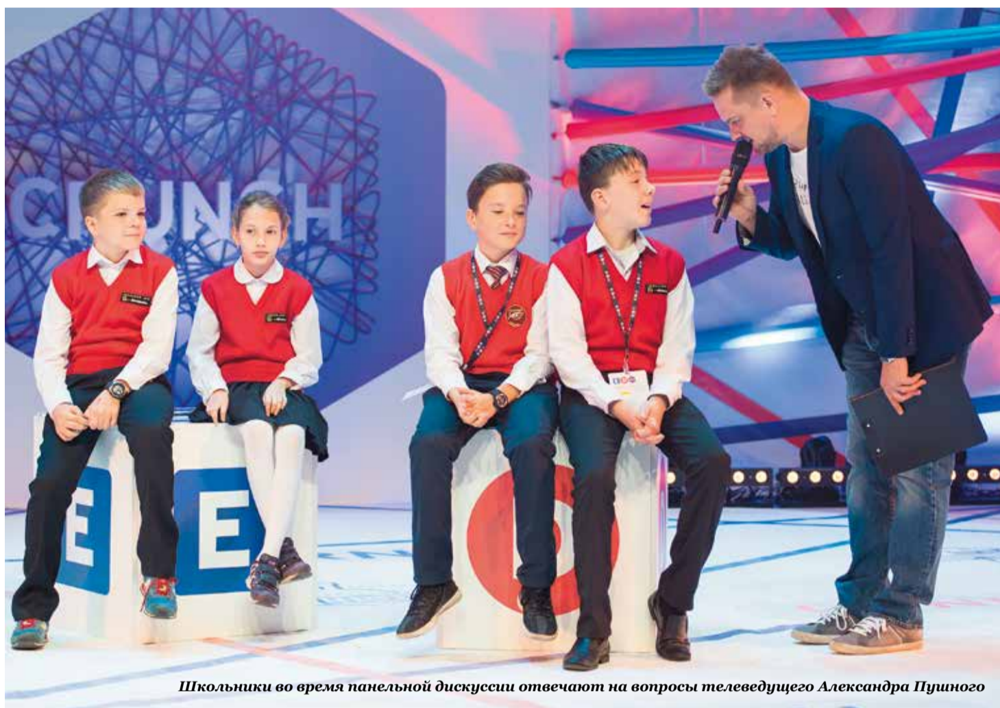
Школьники во время панельной дискуссии отвечают на вопросы телеведущего Александра Пушиного

ПОНЕДЕЛЬНИК, 30 СЕНТЯБРЯ 2016 ГОДА | № 6 (2778)