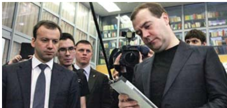
Две истории успеха (стр.3)