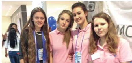
Лидер 21 века (стр.4)