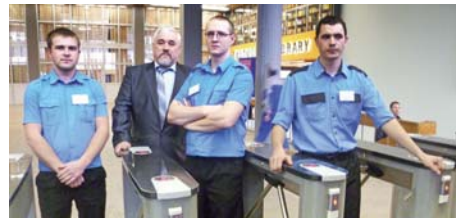
Настоящий мужчина (стр.4)