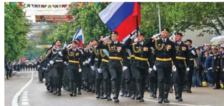
Севастополь родной! (стр. 4)