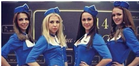
Балерины из МИСиС (стр. 6)