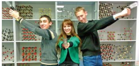
Как дожить до диплома (стр. 6)