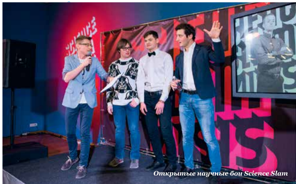
Открытие научных бои Science Slam