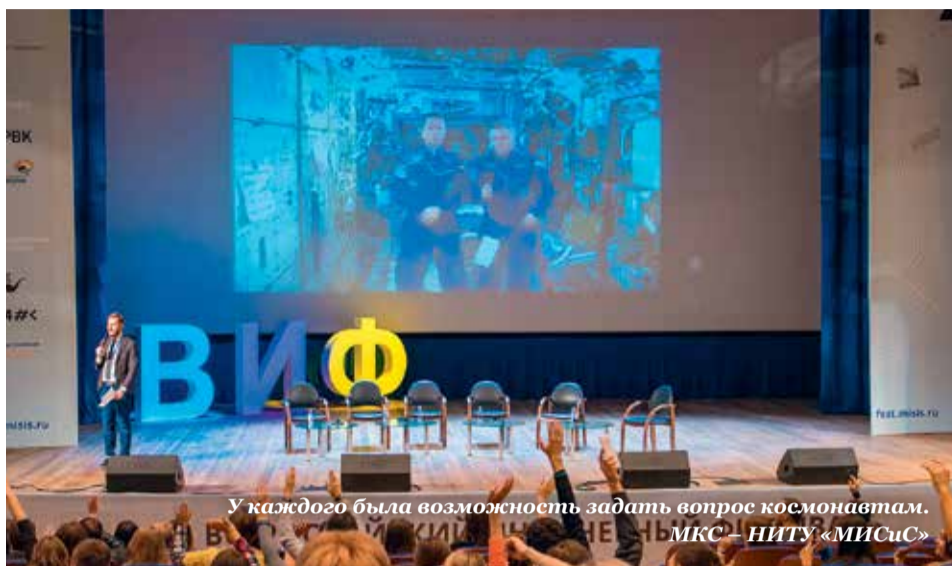
У каждого была возможность задать вопрос космонавтам. МКС – НИТУ «МИСиС»

– Это несложно, ведь мы – не разработчики и не постановщики экспериментов, а только их исполнители. Перед полетом в космос тщательно прорабатываем каждый эксперимент на Земле, поэтому го-