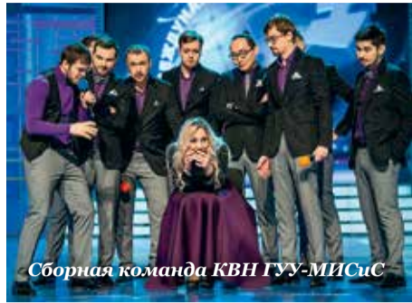
Сборная команда КВН ГУУ-МИСиС