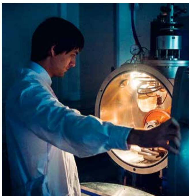
В лаборатории «Перспективные энергоэффективные материалы» создаются новые материалы на основе железа для использования в качестве магнитных, твердых покрытий и антирадиационных материалов.