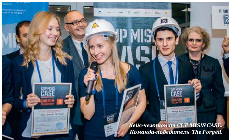
Кейс-чемпионат CUP MISIS CASE. Команда-победитель The Forged.

■ Выпускник вуза боксер Евгений Тищенко стал чемпионом Олимпийских игр в Рио-де-Жанейро.