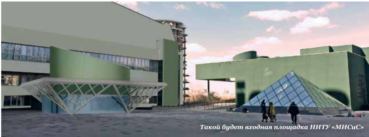
Такой будет входная площадка НИТУ «МИСиС»