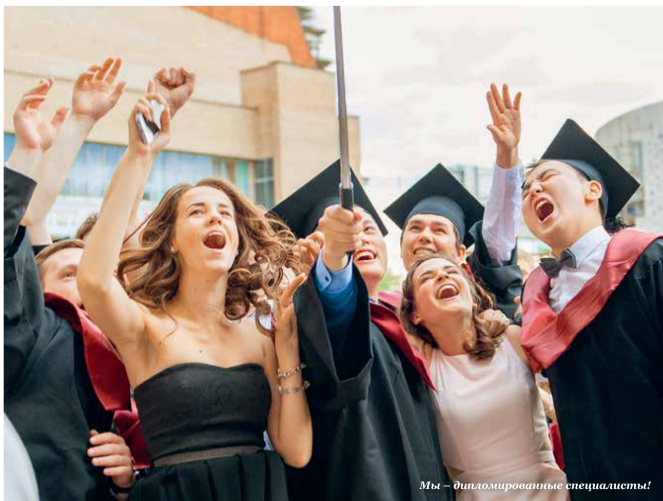
Мы – дипломированные специалисты!