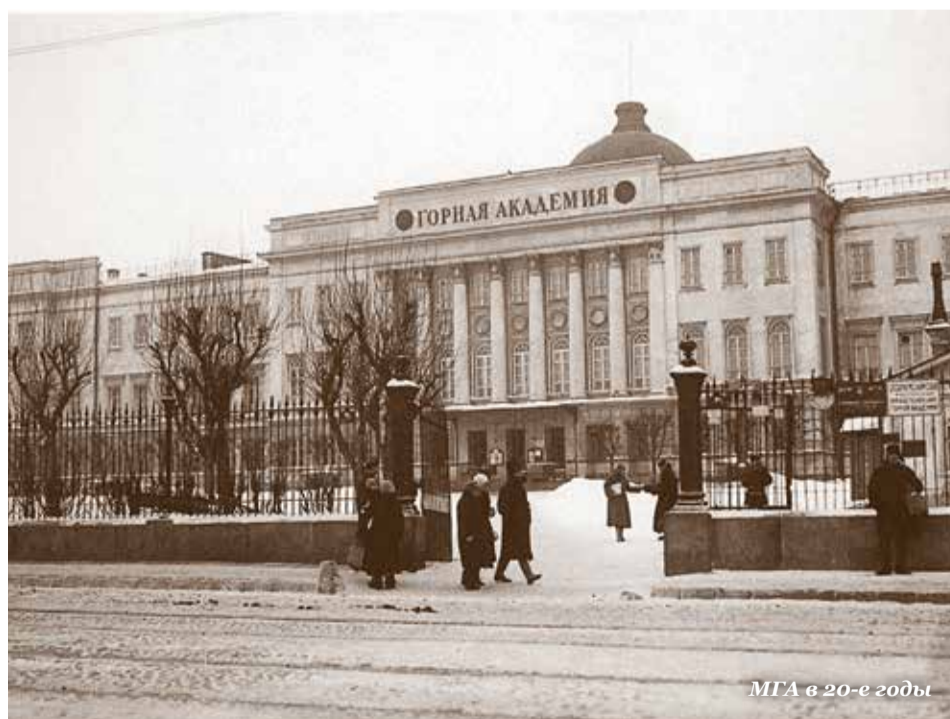
МГА в 20-е годы

В те годы страна приступала к реконструкции всех отраслей народного хозяйства. Нужны были специалисты. 13 января 1930 года вышло постановление «О подготовке технических кадров для народного хозяйства СССР», и вслед за этим началась реорганизация «многофакультетных высших учебных